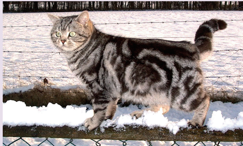
Rimare's Archibald , geb 16-05-2000

wat minder mooi, maar daar moet je als fokker doorheen kunnen en willen kijken. Oudere dekkaters worden helaas om die reden niet frequent bezocht met als gevolg dat de eigenaren vaak besluiten om ze te sluiten. Vier dekkingen per jaar is voor een oude knar ook niet te doen. Dood- en doodzonde is dat. Wandelende bankrekeningen zijn zij dus zeker niet.