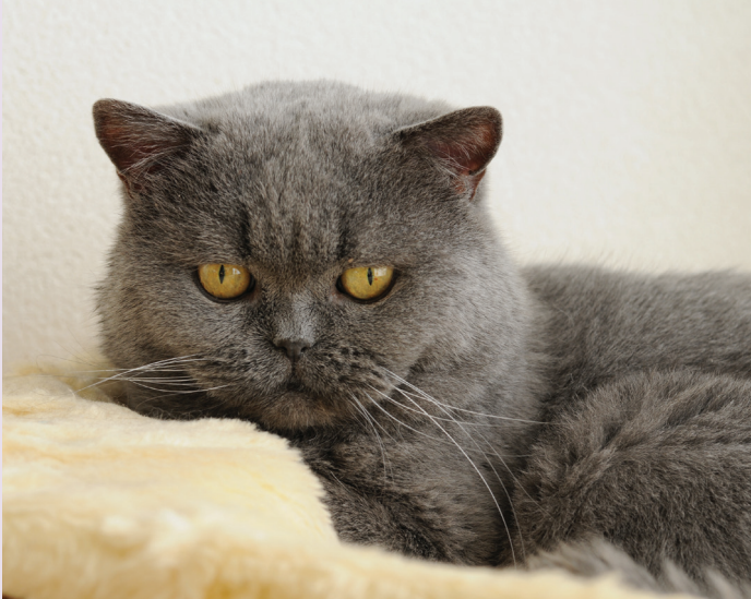
Archie Llamados geb: 27-01-1996

helemaal niets meer over deze 'kampioenen'. Als een kip zonder kop lopen deze fokkers vaak ook nog naar één en dezelfde dekkater toe, alsof alleen de genen van de dekkater bepalend zijn voor de kittens. Ik hoef u niet te vertellen wat dat doet met de genenpool van ons geliefde ras. En dan heb ik het niet eens over fokkers die ook nog eens alle dekkaters met bloedgroep-A uitsluiten voor de fok,