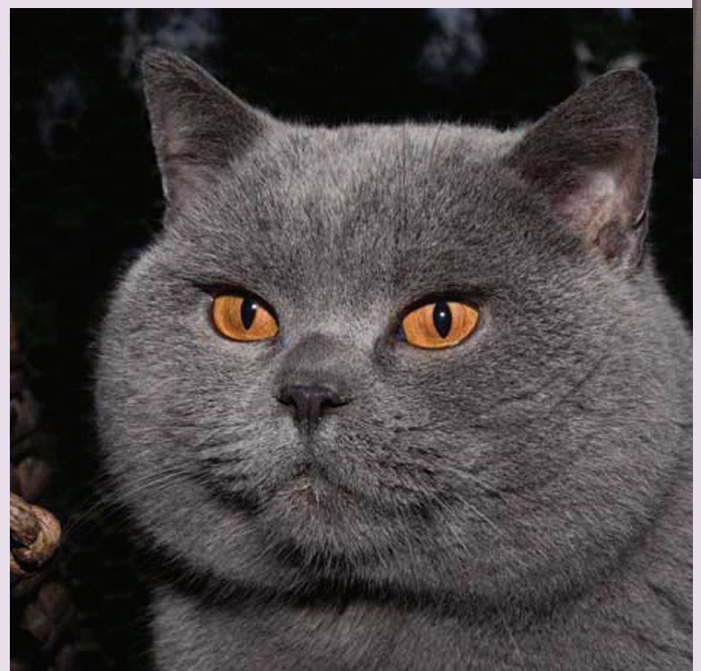
Cattractive Columbus geb. 03-04-2000

niet de minste moeite nemen zich te informeren over de afstamming van deze katers. Bovendien worden deze jonge dekkaters vaak na een jaar of drie gesloten en herplaatst en weten we daarna