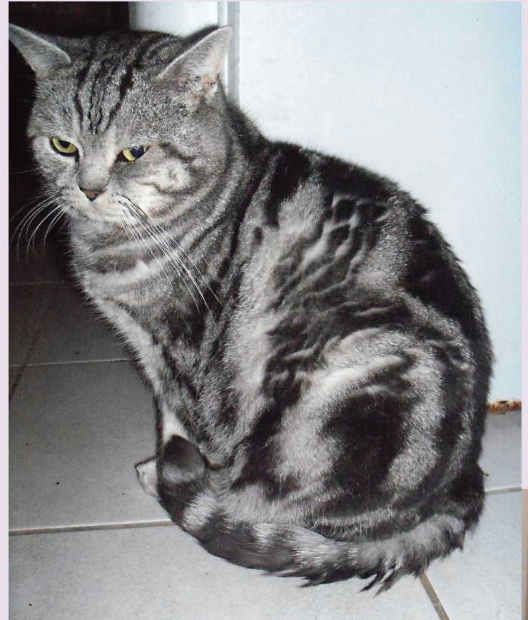
Marvellous Silver Jasper geb. 29-03-2002

Het valt mij de laatste tijd toch al op dat veel fokkers op shows op zoek zijn naar jonge mooie katers met kampioentitels, maar dat zij