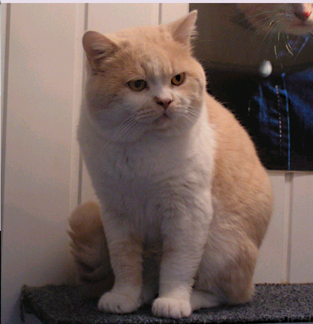
Gentleman Paddy van de Haber geb. 01-10-1997

helemaal niets meer over deze 'kampioenen'. Als een kip zonder kop lopen deze fokkers vaak ook nog naar één en dezelfde dekkater toe, alsof alleen de genen van de dekkater bepalend zijn voor de kittens. Ik hoef u niet te vertellen wat dat doet met de genenpool van ons geliefde ras. En dan heb ik het niet eens over fokkers die ook nog eens alle dekkaters met bloedgroep-A uitsluiten voor de fok,